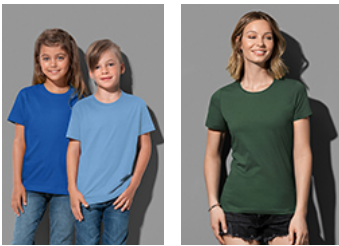
ST2200 Classic-T Kids